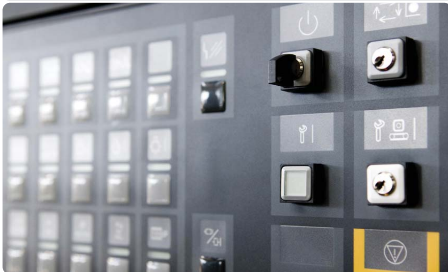
Bild 3: Service auf Knopfdruck: Über einen Taster mit integrierter Status-LED im Bedienfeld der Anlage veranlasst ein Kunde den mGuard Router im Schaltschrank zum Aufbau bzw. Abbau der sicheren Teleservice-Verbindung und hat deren Zustand mit einem Blick unter Kontrolle.

zung und Netzwerk-Integration zum Gelingen des Projekts bei und ist heute begeistert von der vereinfachten Administration der Teleservice-Infrastruktur. Die erste produktive Inbetriebnahme des Portals erfolgte nach einer Projektlaufzeit von neun Monaten inklusive Entwicklung aller Module und Schnittstellen Mitte 2009. Eine zweite Phase der weiteren Automatisierung und Optimierung wurde Ende 2009 abgeschlossen. Die laufende Betreuung des Betriebs erfordert nur geringen Aufwand. Die Aufnahme einer neuen Maschine inklusive montage- und betriebsfertiger Einrichtung eines mGuard Feldgeräts als VPN-Router dauert dank der Device Management Software und des schlanken Portalaufbaus mit Integration ins ERP-System nur wenige Minuten.