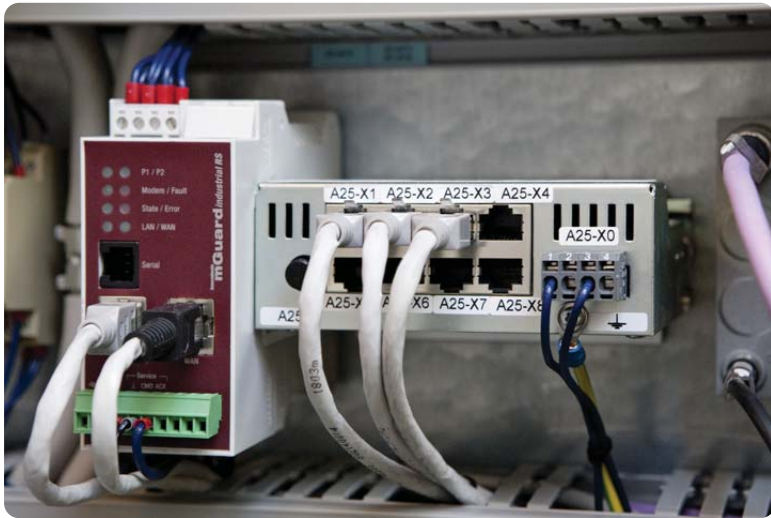
Bild 2: Als sichere VPN-Router verbaut Bihler in seinen Maschinenschaltschränken industrietaugliche mGuard Hutschienengeräte von Innominate.

dass sich ausgehende VPN-Verbindungen durch den Kunden einfach schalten und kontrollieren lassen. Die effiziente Konfiguration der Geräte über eine Device Management Software und die technische Unterstützung der Lucom GmbH als zertifiziertem Systempartner waren weitere entscheidende Faktoren. Auch als zentrale VPN-Infrastruktur werden mGuard Geräte von Innominate genutzt.