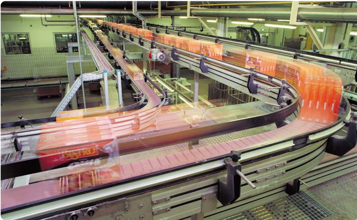
Bild 1: Die miprotek GmbH ist u.a. im Bereich der innerbetrieblichen Förder-technik tätig.