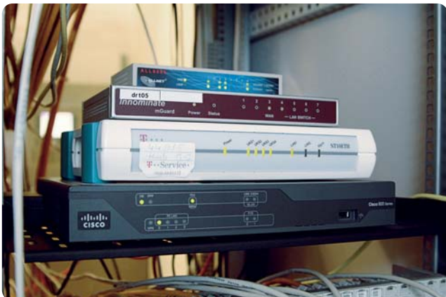
Bild 3: Der zentral installierte FL MGuard Delta (zweites Gerät von oben) nimmt sämtliche VPN-Verbindungen entgegen.